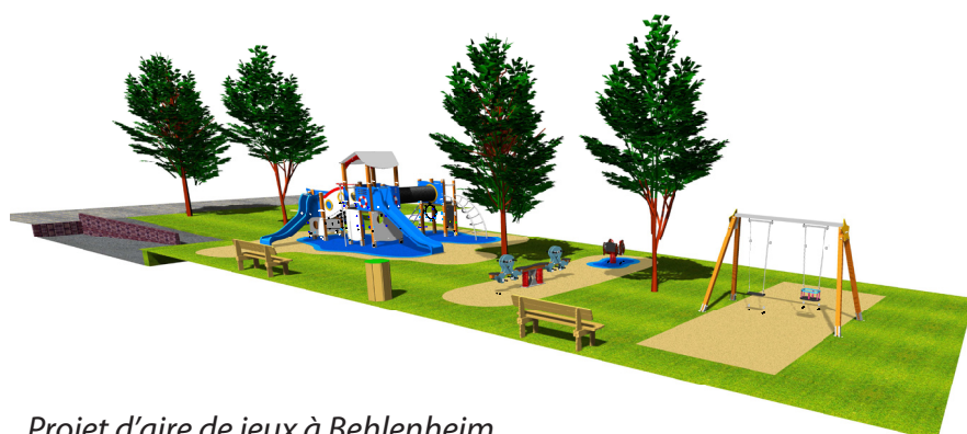
Projet d'aire de jeux à Behlenheim

Le budget d'investissements s'élève pour sa part à 7 262 457 € et devrait être réalisé sans recours à l'emprunt si les subventions attendues sont confirmées. Les années à venir seront néanmoins moins chargées en investissements.