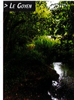
> LE GOYEN

La topographie de Plonéis est particulièrement variée offrant de multiples et splendides points de vue, des chemins creux et des sites attachants.