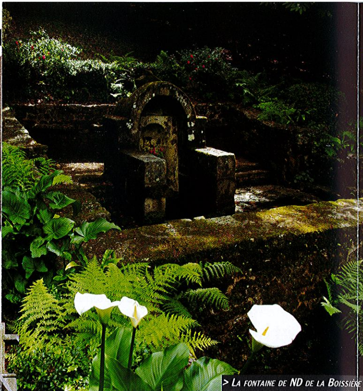
> LA FONTAINE DE ND DE LA BOISSIÈRE

Morice du Marc'hallac'h, chef royaliste fut tué en 1590 au siège du château de Guengat.