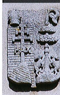
> DÉTAIL DE LA CHAPELLE STE-ANNE

Enfin, le jumelage avec le village de Jovençan dans le Val d'Aoste est l'occasion de nombreuses animations culturelles et sportives.