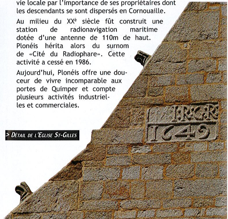
> DÉTAIL DE L'ÉGLISE ST-GILLES

Aujourd'hui, Plonéis offre un cadre de vivre incomparable aux portes de Quimper et compte plusieurs activités industrielles et commerciales.