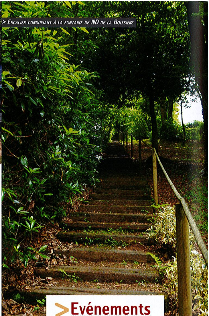
> ESCALIER CONDUISANT À LA FONTAINE DE ND DE LA BOISSIÈRE