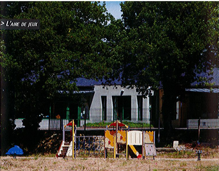
> L'AIRE DE JEUX