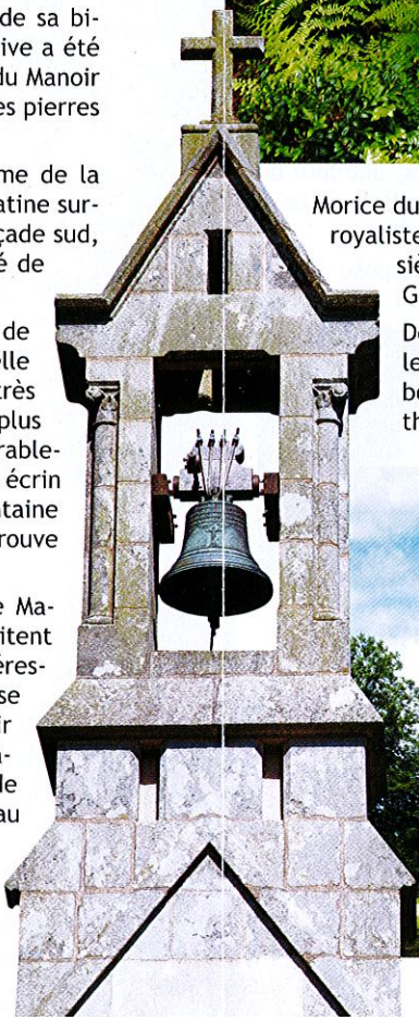
> CLOCHER DE LA CHAPELLE STE-ANNE

Le territoire de Plonéis est aussi celui de Manoirs et de Château. La plupart ne se visitent pas mais ils offrent des points de vue intéressants sur l'architecture dédiée à la noblesse bretonne dès le XV e siècle. Ainsi, le Manoir de Kerven fut élevé en 1651 au rang de châtelainie par décision royale. Le château de March'hallac'h édifié au XVI e est le berceau d'une famille qui prit le nom de sa terre.