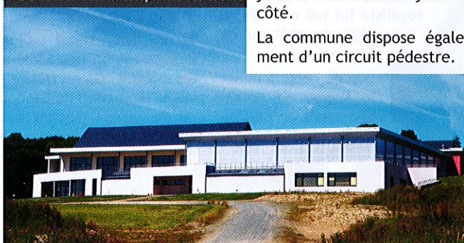
> L'ENSEMBLE MÉDIATHÈQUE/HALLE DES SPORTS

La commune dispose également d'un circuit pédestre.