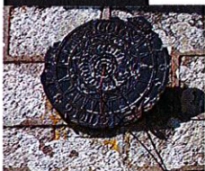
> CADRAN SOLAIRE À ND DE LA BOISSIÈRE