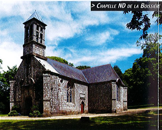
> CHAPELLE ND DE LA BOISSIÈRE